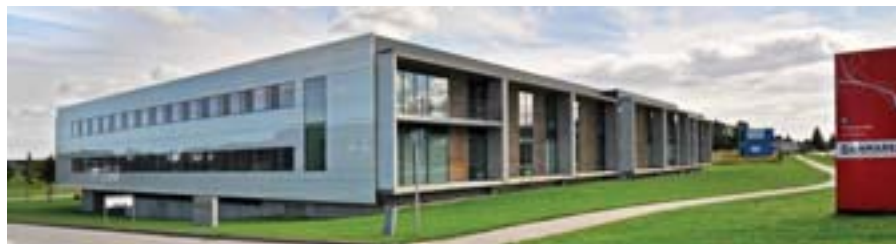
DAB's nye domicil.

Datoen for flytningen ligger endnu ikke fast.